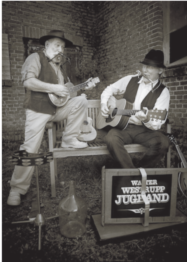
WWJB-Flyer 11-4 - Flyer-Entwurf: Dabelju Production Essen

Kontakt: Walter Westrupp Altstrasse 2 45359 Essen-Schönebeck Tel.: 02 01 - 67 58 51 email: wwjugband@versanet.de www.computopia.de/wwjb.htm